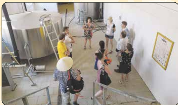
Exkurze vodáků v pivovaru Kynšperk