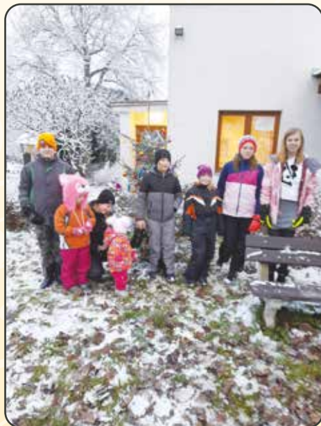
Zpívání pod stromečkem