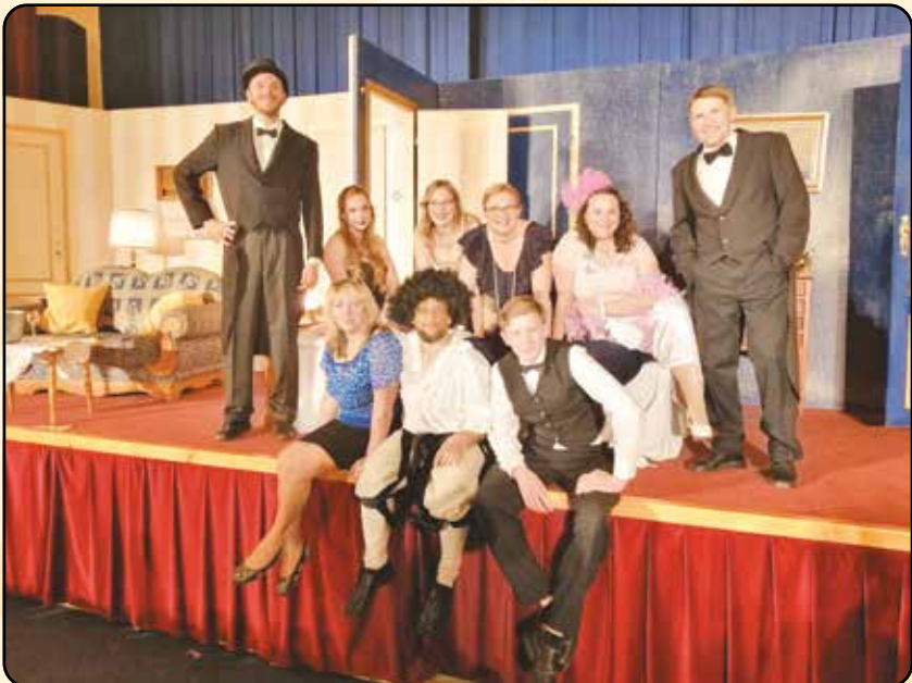
Po představení v Chlumčanech