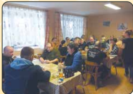
Turnaj v prší