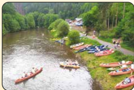
Vodáci – Sázava

K rozvolnění opět došlo s příchodem léta, což využili například vodáci ke splouvání řeky Sázavy, a také příznivci hudby k návštěvám koncertů a festivalů. Větší skupina se již tradičně v srpnu vypravila na festival Chodrockfest do Domažlic.