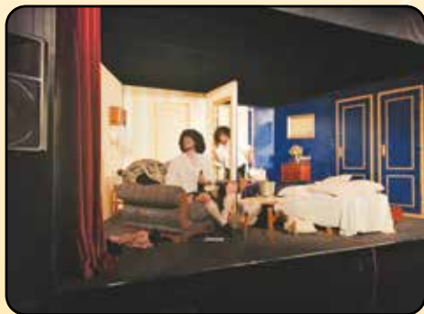
Představení v Nadějkově