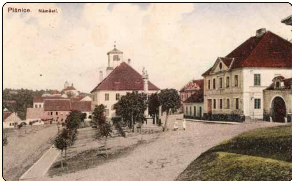
Původní podoba parku z roku 1918