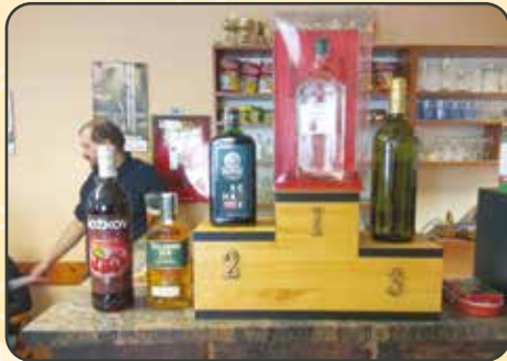
Turnaj v prší