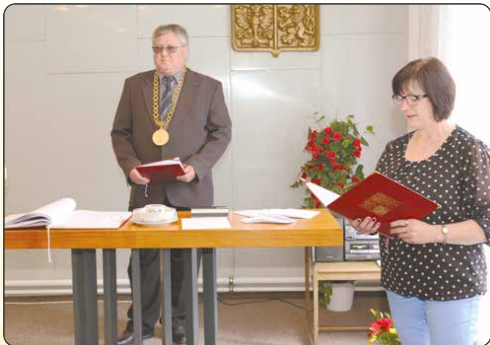
Vítání nových občánek