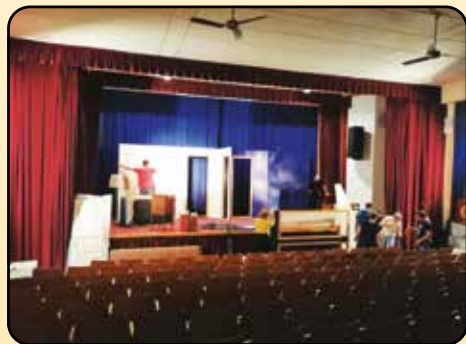
Stavění kulís v Chlumčanech