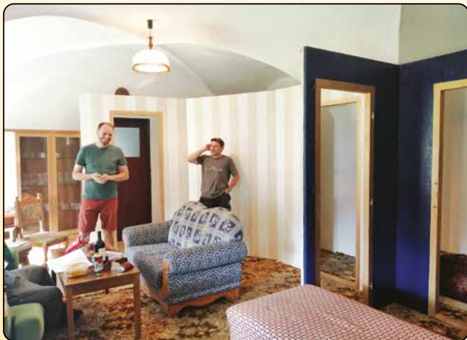
Zkouška v klubovně na zámku

Jak asi víte, v první polovině roku jsme nehráli vůbec. Když se v březnu uzavřely okresy, nikdo si netroufl ani odhadovat, jakým směrem se celá situace bude ubírat. Až později, konkrétně v létě, jsme se konečně po dlouhé době sešli, abychom si popovídali a probrali, jaké máme možnosti. Vznikl tak plán zkoušek na celkem 3 představení. Oprašování mohlo začít. Naštěstí většina z nás texty v hlavě našla, stačilo si všechno jen trochu připomenout a rychle jsme se dostali do svých rolí zpět.